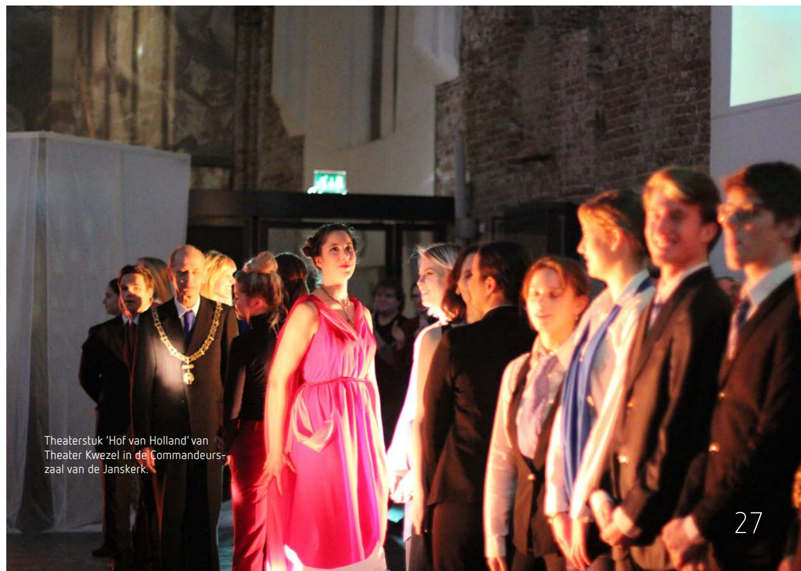
Theaterstuk 'Hof van Holland' van Theater Kwezel in de Commandeurszaal van de Janskerk.