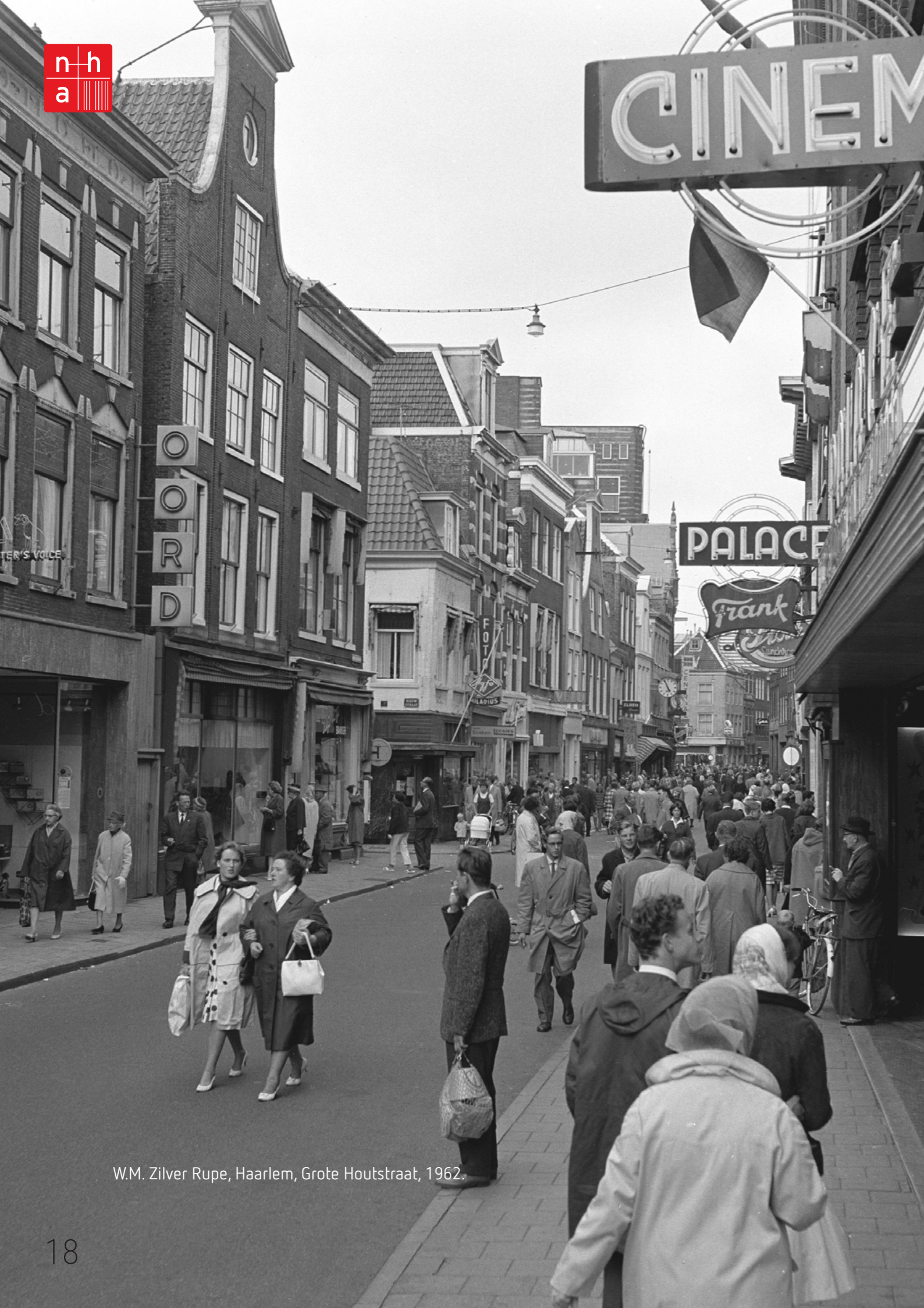
W.M. Silver Rupe, Haarlem, Grote Houtstraat, 1962.