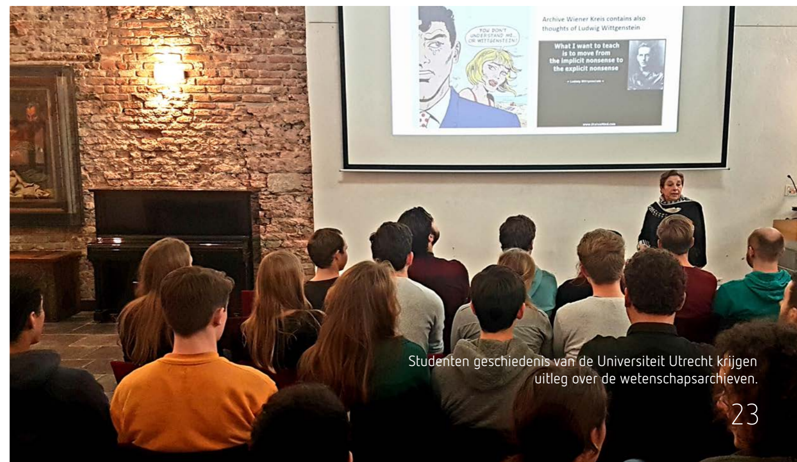
Studenten geschiedenis van de Universiteit Utrecht krijgen uitleg over de wetenschapsarchieven.

Sinds maart 2018 is de Stichting Oneindig Noord-Holland ook op de Jansstraat gehuisvest. De stichting brengt cultureel erfgoed van de provincie Noord-Holland door een verhalenplatform, het aanbieden van routes en door evenementen dichterbij de mensen. Door de vele raakvlakken wordt er ook samengewerkt met het team presentatie van het Noord-Hollands Archief.