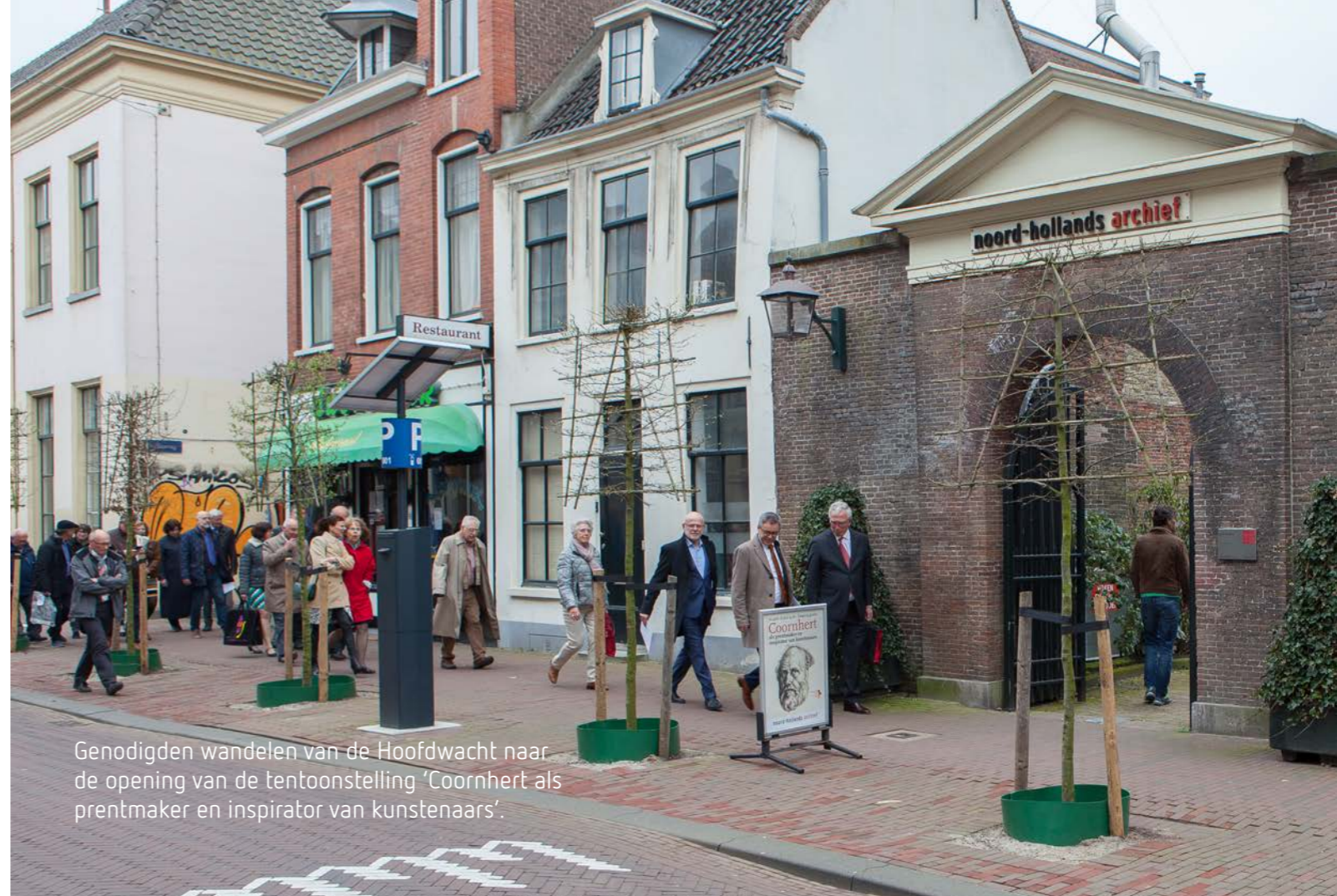
Genodigden wandelen van de Hoofdwacht naar de opening van de tentoonstelling 'Coornhert als prentmaker en inspirator van kunstenaars'.

De bibliotheek van het Noord-Hollands Archief werd uitgebreid met 113 aanwinsten. In opdracht