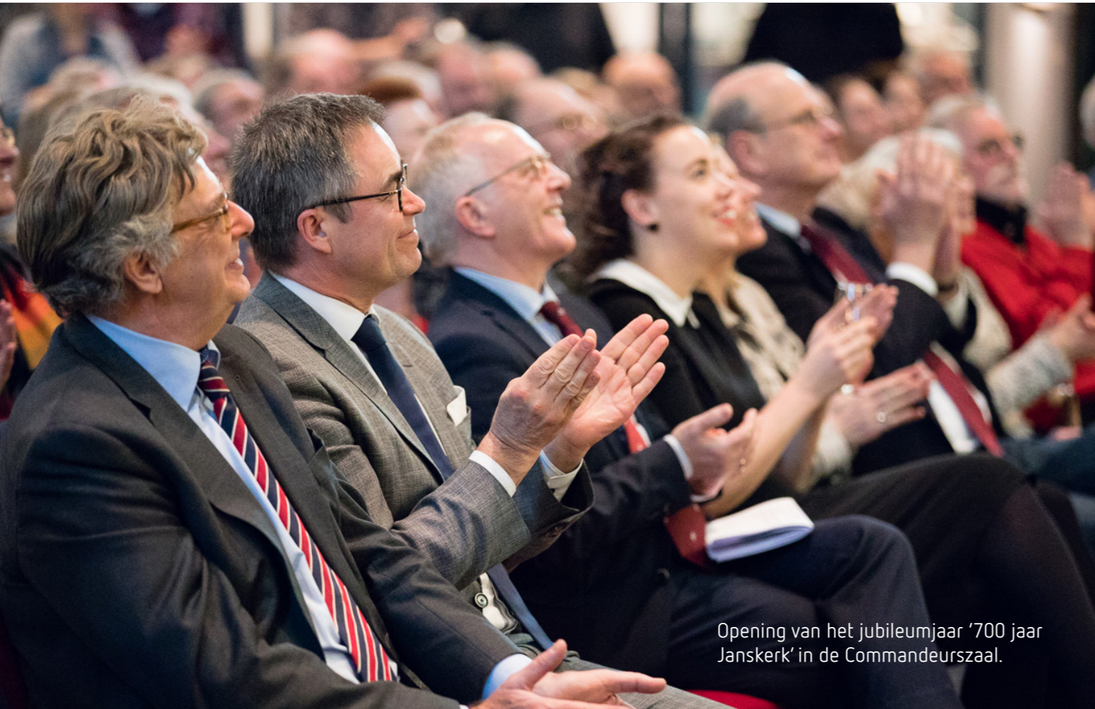
Opening van het jubileumjaar '700 jaar Janskerk' in de Commandeurszaal.