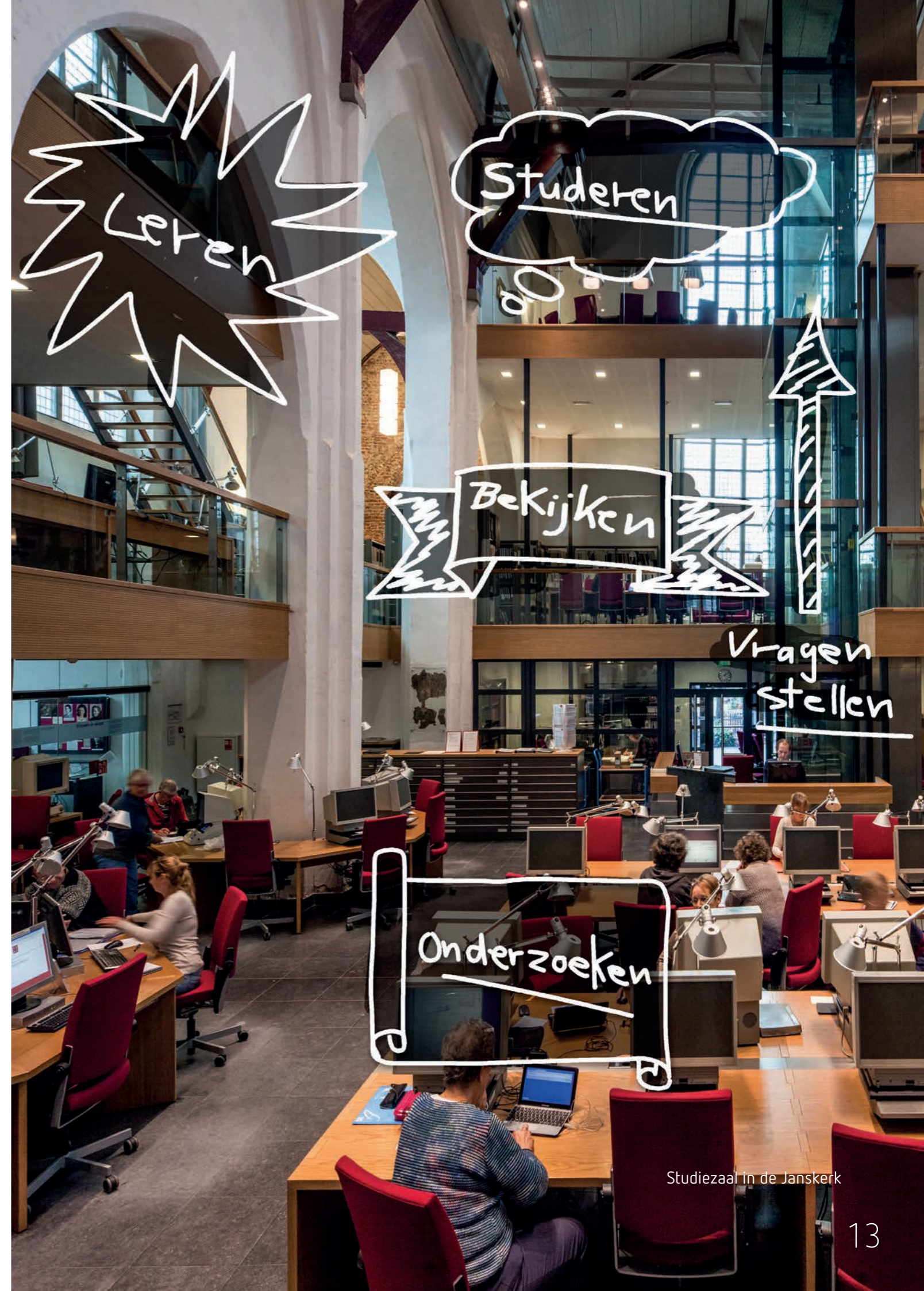
Studiezaal in de Janskerk

De gemaakte stappen zijn echter minder groot dan gewenst, daarom wordt er vanaf 2019 gewerkt aan een uitbreiding van de bemanning van de desbetreffende afdeling om voldoende service te kunnen bieden. Met ingang van 2019 wordt van alle deelnemende overheden een financiële bijdrage voor de digitale informatievoorziening gevraagd.