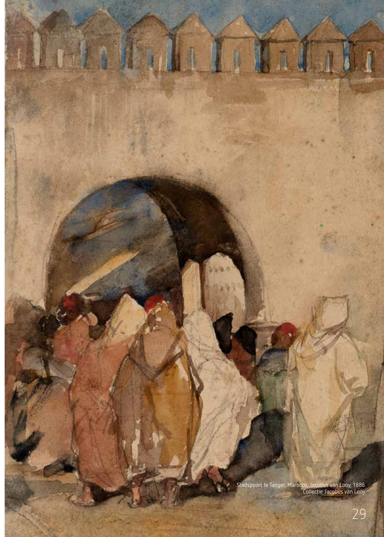
Stadspoort te Tanger, Marocco, Jacobus van Looy, 1886. Collectie Jacobus van Looy.

In totaal werden er in 24 objecten in bruikleen gegeven. In de tentoonstelling 'Haarlemse helden. Andere Meesters' in het Frans Hals Museum waren Het Schilderboek van Karel van Mander en het 'Liber memoriarum domus hospitalis S. Joannis Hierosolimitani in Haerle(m)' te zien. Teylers Museum leende voor de tentoonstelling 'Jong in de 19e eeuw' het boek 'Gedichten voor kinderen' van Hieronymus van Alphen. Verder waren er in de tentoonstelling 'Wie was de Mol' op Kasteel-Museum Sypsteyn objecten te zien. Ook het Museum Haarlem had gedurende het jaar diverse bruiklenen van het NHA in huis.