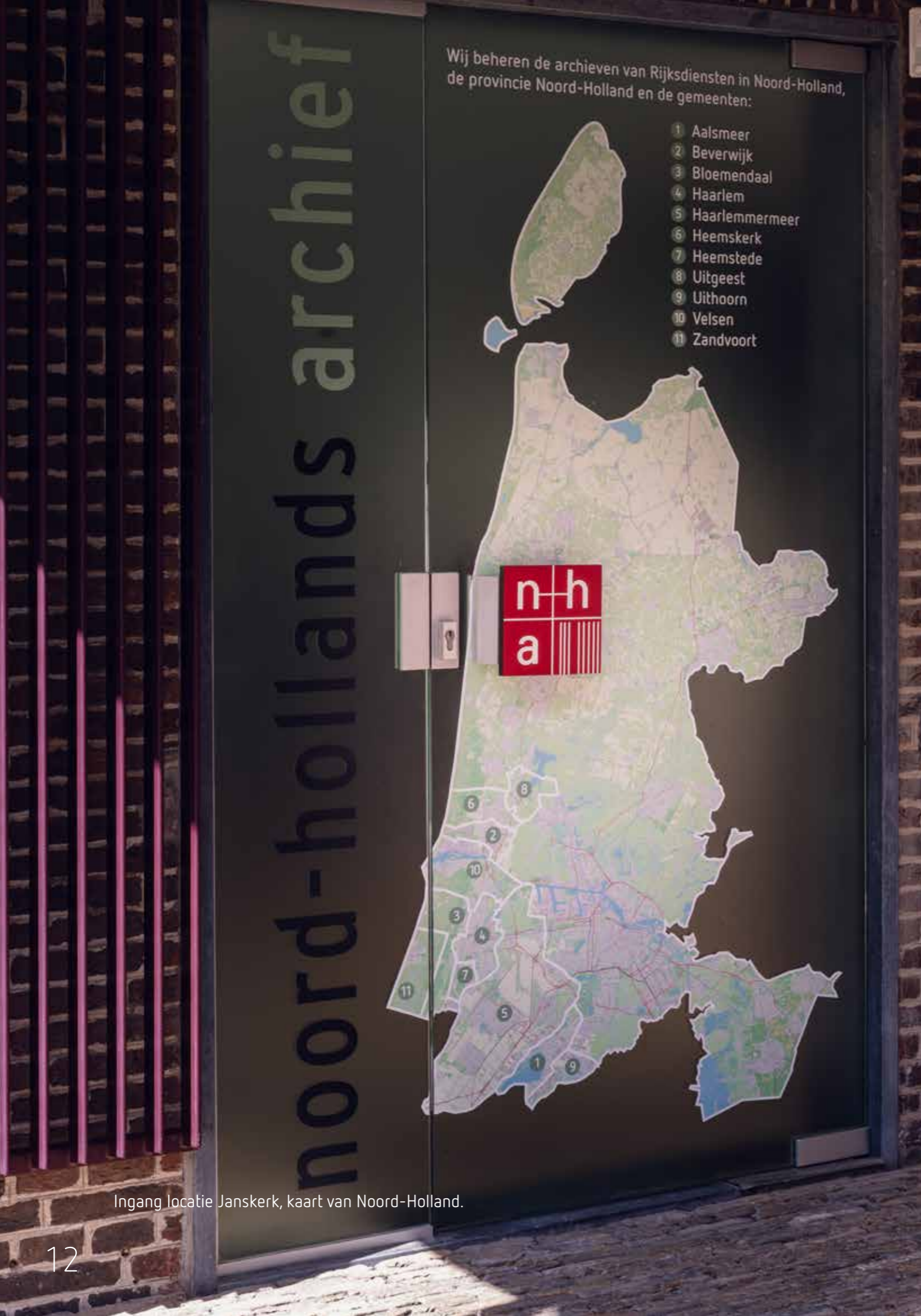
Ingang locatie Janskerk, kaart van Noord-Holland.