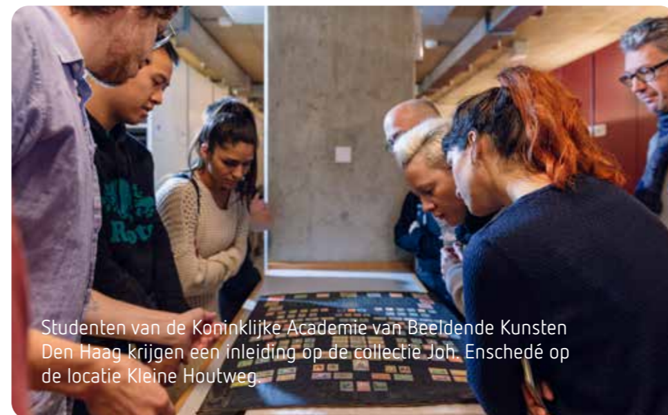
Studenten van de Koninklijke Academie van Beeldende Kunsten Den Haag krijgen een inleiding op de collectie Joh. Enschedé op de locatie Kleine Houtweg.