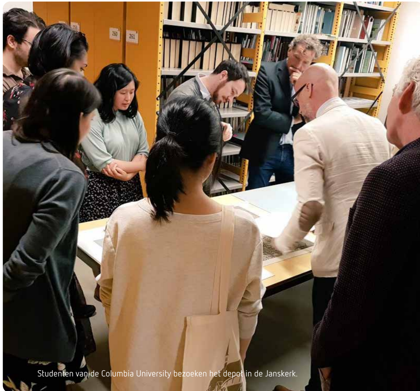
Studenten van de Columbia University bezoeken het depot in de Janskerk.

Aan de studiezaal in Hoofddorp zijn 68 (2018: 77) bezoeken gebracht.