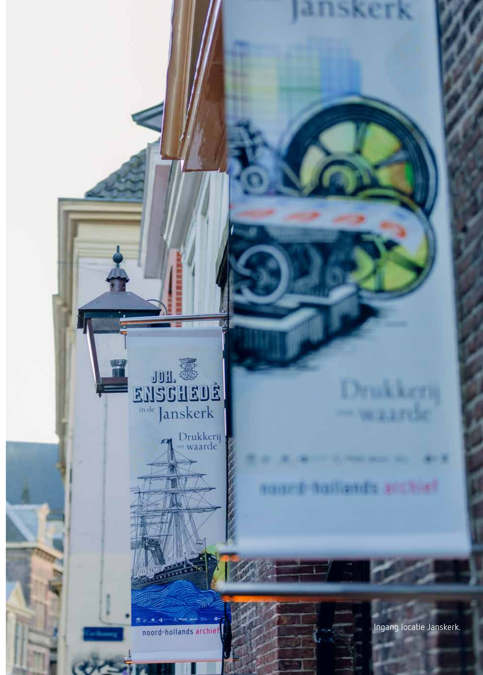
Ingang locatie Janskerk.