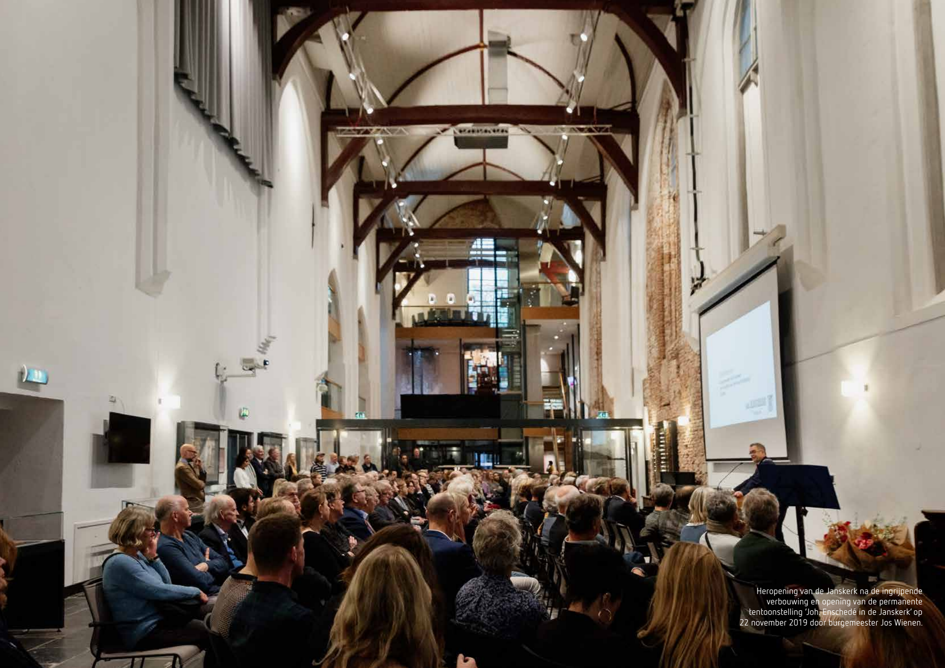
Heropening van de Janskerk na de ingrijpende verbouwing en opening van de permanente tentoonstelling 'Joh. Enschedé in de Janskerk' op 22 november 2019 door burgemeester Jos Wielen.