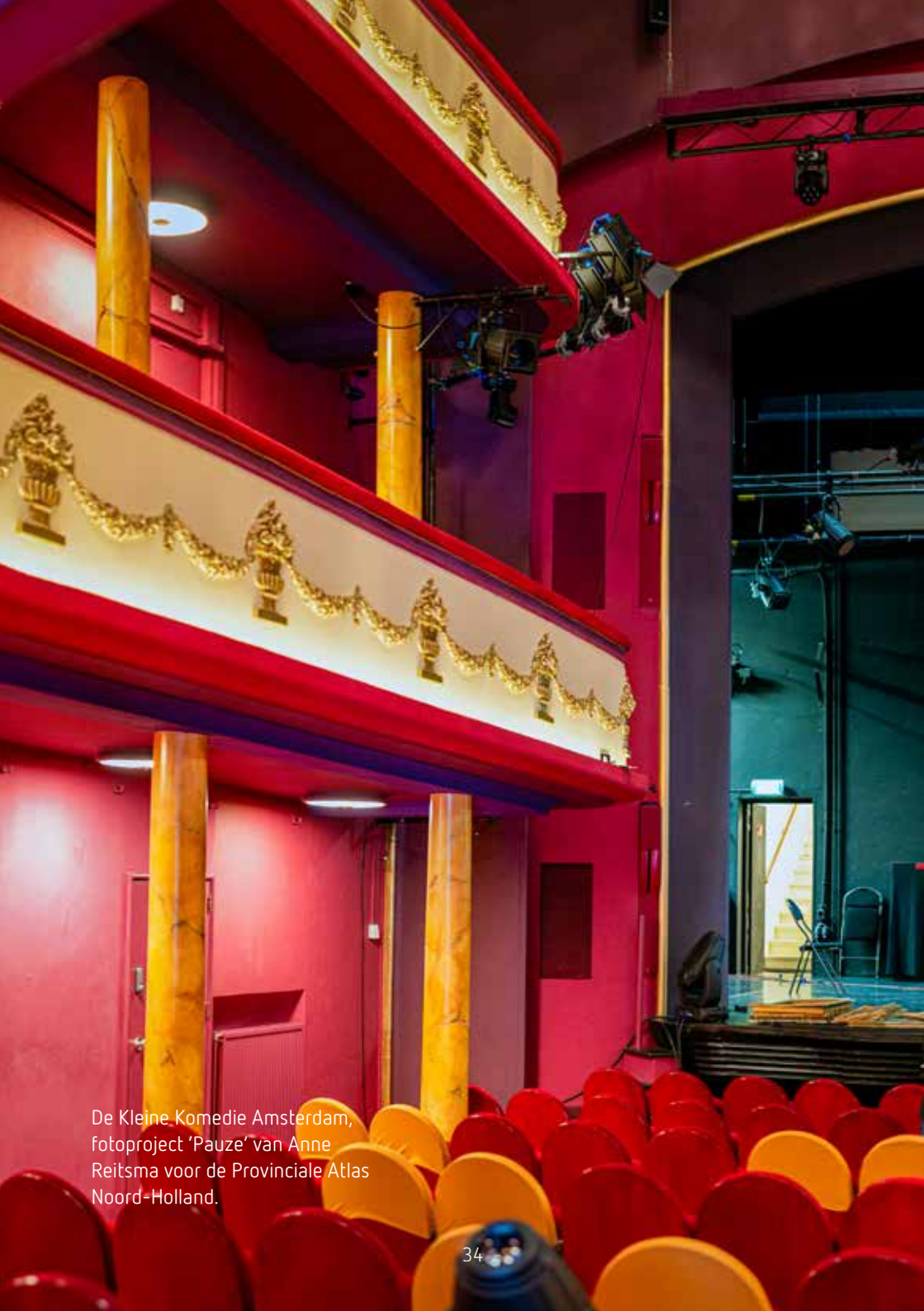
De Kleine Komedie Amsterdam, fotoproject 'Pauze' van Anne Reitsma voor de Provinciale Atlas Noord-Holland.