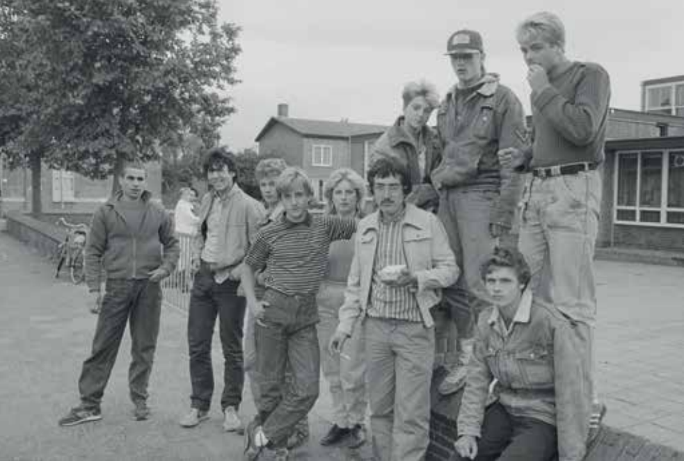
Jongeren uit de Radarstraat IJmuiden, 1984.

Eindredactie en productiebegeleiding Annabelle Arntz