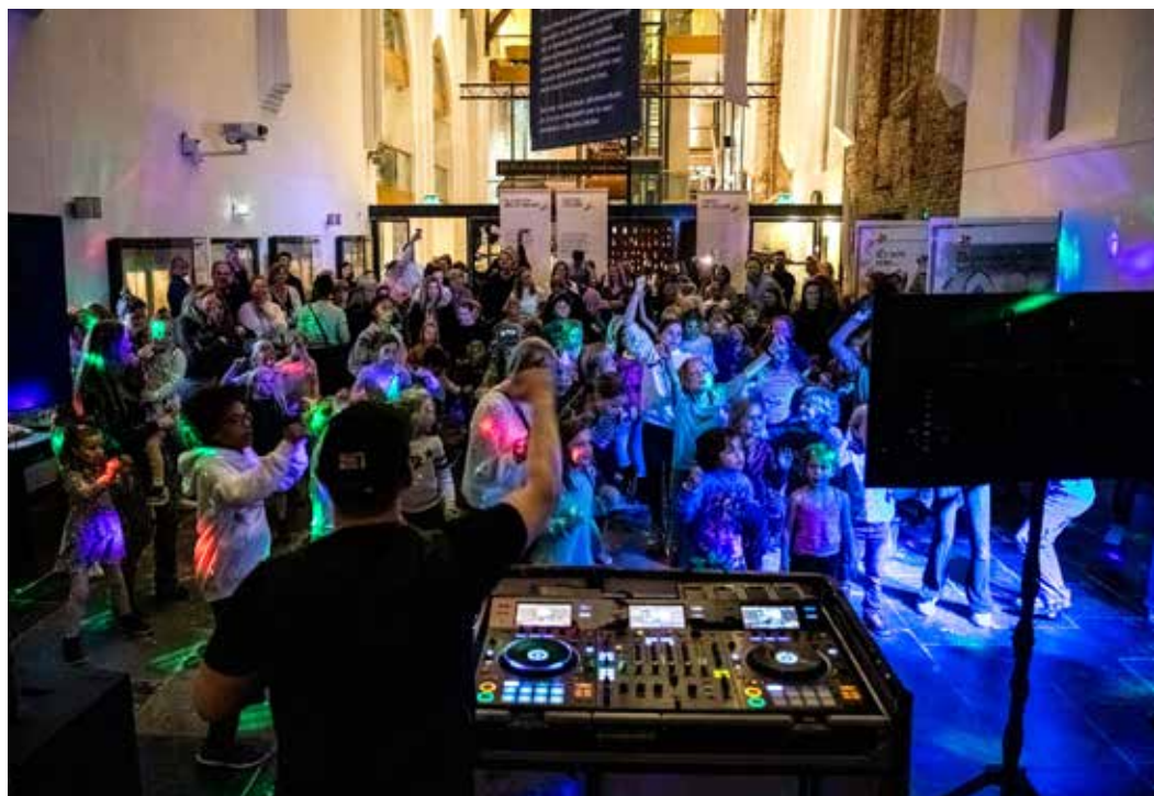
Disco in de Commandeurszaal in de Janskerk als afsluiting van de Museumnacht Kids 2021.