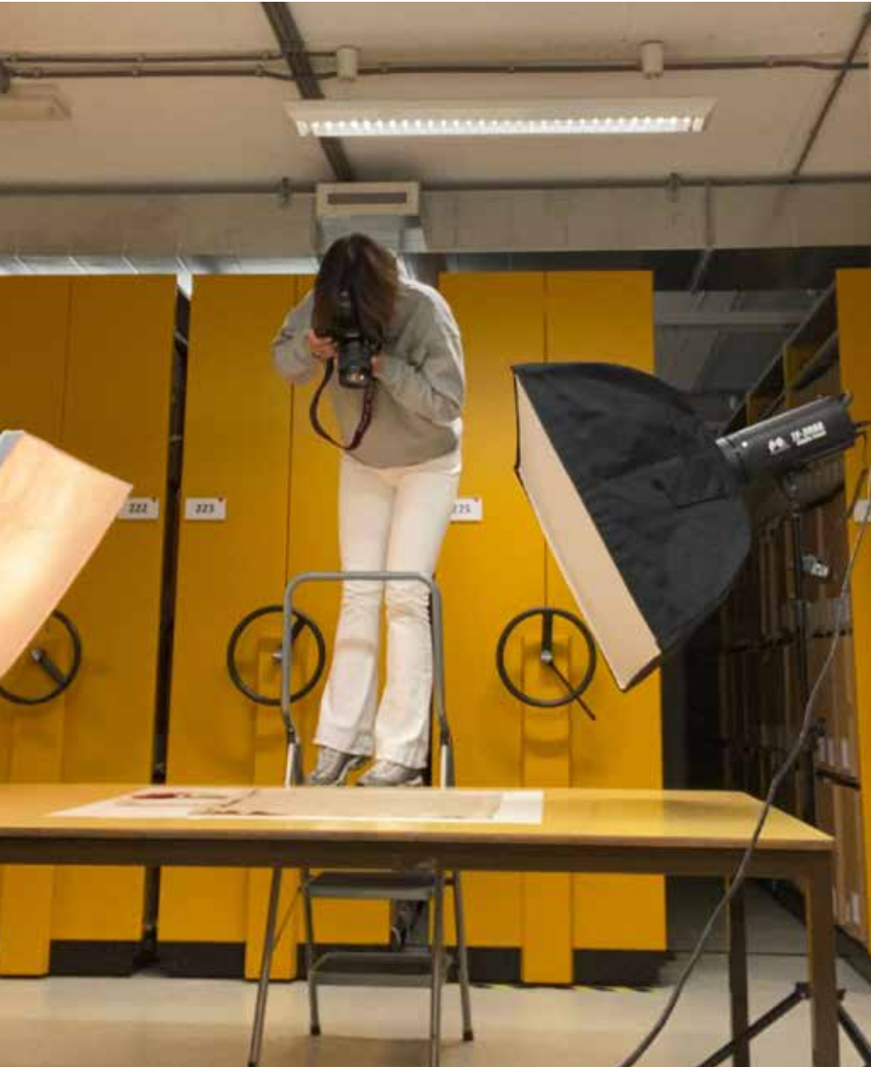
Fotograferen van twee charters in het depot van de Janskerk.