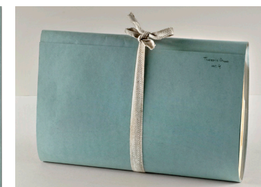
Om een dikke bundel doet u een lint met de strik aan de bovenkant.

Als de bundel erg dik is, kunt u er een lint omheen doen met de strik aan de bovenkant. Fotoalbums, plakboeken, boeken, registers en dergelijke, plaatst u ook in een omslag met de rug naar beneden.